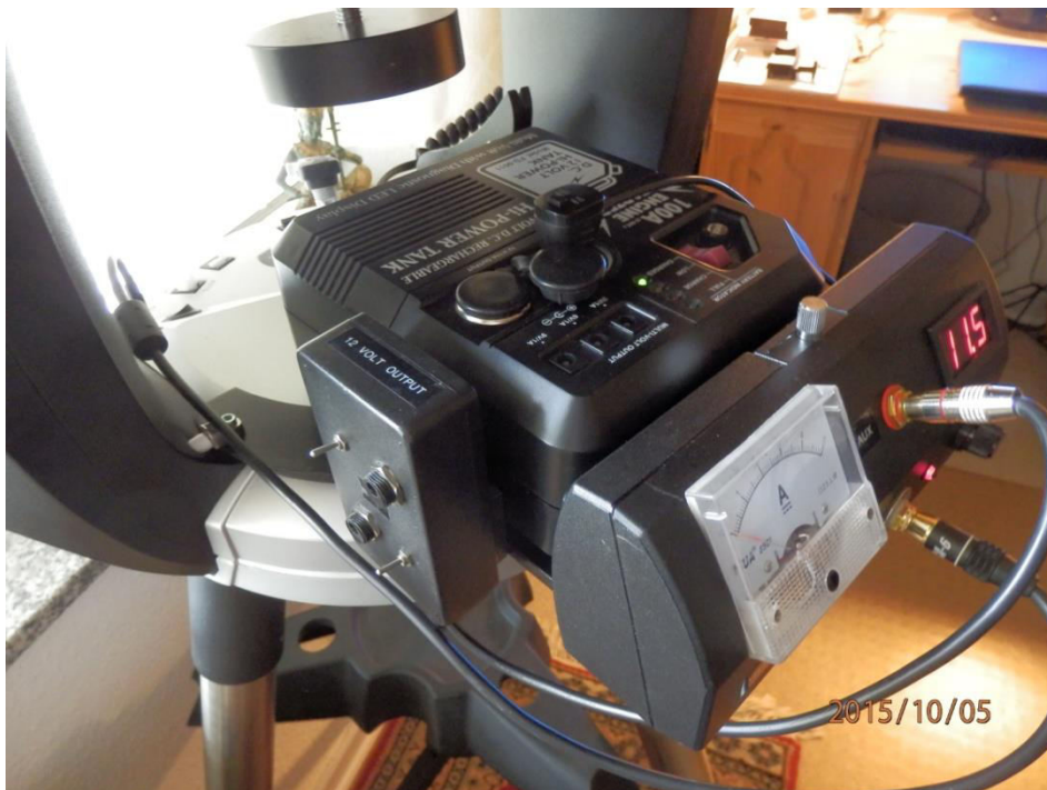
Strømforsyning og amperemeter følger nu teleskopets bevægelser uden "kabelsalat".